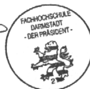
Abbildung 6: Diplomzeugnis 1/3